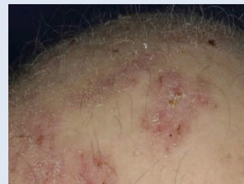
Aktinische Keratosen (AK)

Das maligne Melanom (MM) gehört zu den bösartigsten Krebsarten überhaupt. Ein Teil der MMs geht aus Leberflecken hervor, so dass eine Ähnlichkeit gerade im Anfangsstadium häufig ist. Das MM kommt bei Transplantierten nur geringgradig häufiger vor, als bei Nicht-Transplantierten. Trotzdem sollten große (>5 mm), ungleichmäßig gefärbte, unregelmäßig begrenzte, asymmetrische oder gar blutende Muttermale kontrolliert werden. Gleiches gilt für wachsende oder neu aufgetretene, dunkel pigmentierte Flecken auf der Haut.