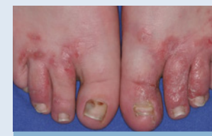
Fuß- und Nagelpilz

Die Pityriasis versicolor ist eine ungefährliche, aber gelegentlich juckende Erkrankung, die durch bestimmte Hefepilze verursacht wird. Besonders an Körperstamm, Oberarmen und Hals finden sich hellbräunliche Flecken, die bei sonnengebräunter Haut auch weißlich erscheinen können. Eine Behandlung mit entsprechenden Shampoos und Lotionen ist hier angezeigt.