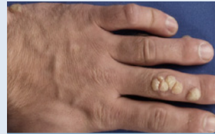
Verrucae vulgares (Viruswarzen)

Es gibt viele verschiedene Virustypen. Warzen werden durch das Humane Papilloma Virus (HPV) verursacht. Auch noch Jahre nach der Transplantation können Warzen beetartig an sonnenlichtexponierten Hautarealen sowie an Hand- und Fußflächen auftreten. Neben dem Sonnenlicht sind auch Durchblutungsstörungen, etwa durch Rauchen bedingt, wichtige Kofaktoren für die Entstehung von Warzen. Bei der Behandlung sollte daran gedacht werden, dass Warzen häufig tief in die Haut eindringen können. Erst nach einer manchmal langwierigen Abtragung der Warzenoberfläche etwa durch Pflaster, können die Viren mittels einer entsprechenden Tinktur auch in der Tiefe der Warze bekämpft werden. Auch durch eine Cremetherapie mit dem immunmodulierenden Wirkstoff Imiquimod, durch eine Farbstofflasertherapie oder Kryotherapie („Vereisen“) können Warzen behandelt werden.