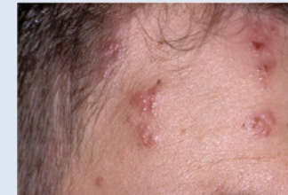
Herpes Zoster (Gürtelrose)

Die Gürtelrose (Herpes Zoster) tritt meist einseitig, gürtel- oder sektorenartig im Versorgungsgebiet von Hautnerven auf. Verbunden damit ist meist ein stechender oder beißender Schmerz. Während Herpes simplex in der Frühphase - also noch vor dem Auftreten von Bläschen - mit Aciclovirhaltigen Cremes behandelt werden kann, muss die Gürtelrose immer durch einen Arzt behandelt werden. Neben einer desinfizierenden Lokaltherapie und Tabletten müssen manchmal Infusionsbehandlungen eingesetzt werden, zur Virenbekämpfung.