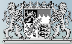
Dr. Ludwig Spaenle Bayerischer Staatsminister für Bildung und Kultus, Wissenschaft und Kunst